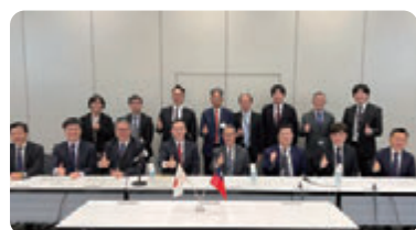
政府高層訪日交流團