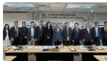
經濟部與經產省重要溝通管道-台日搭橋會議