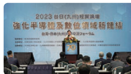
2023台日九州經貿論壇王部長致詞