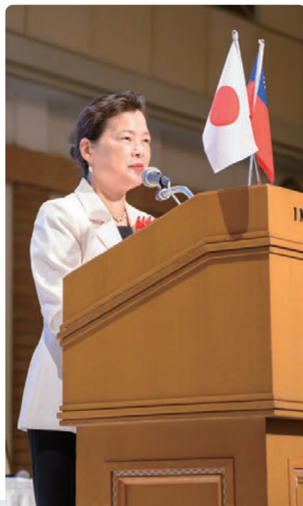
經濟部長於2022台日搭橋論壇致詞