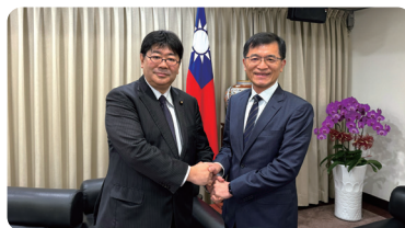
經濟部次長接見日本 參議院議員