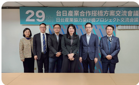
經濟部與經產省重要溝通管道－ 台日搭橋會議