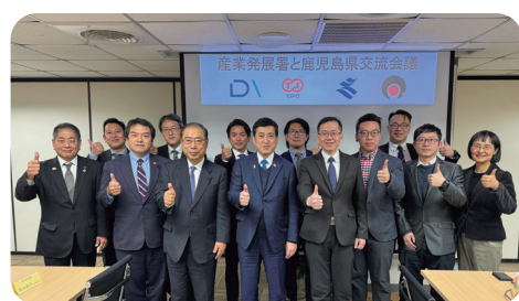
產發署署長接見鹿兒島縣知事