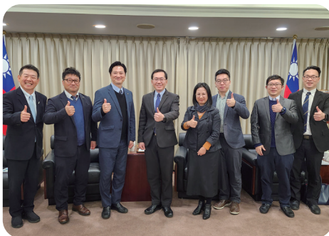
經濟部接見日本關西臺商協會會長 以及日本宮崎縣日向市長