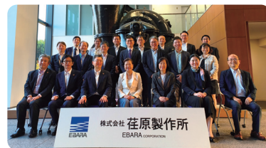
政府高層訪日交流團