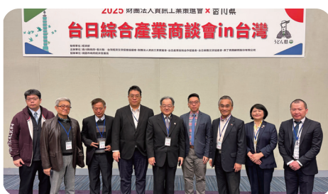
香川縣商談會@台北