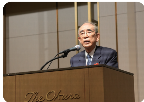
日本台灣交流協會會長 搭橋論壇致詞