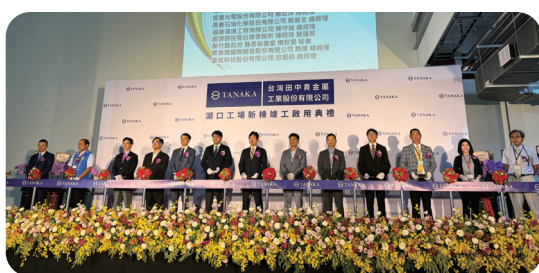
田中貴金屬湖口工廠落成典禮